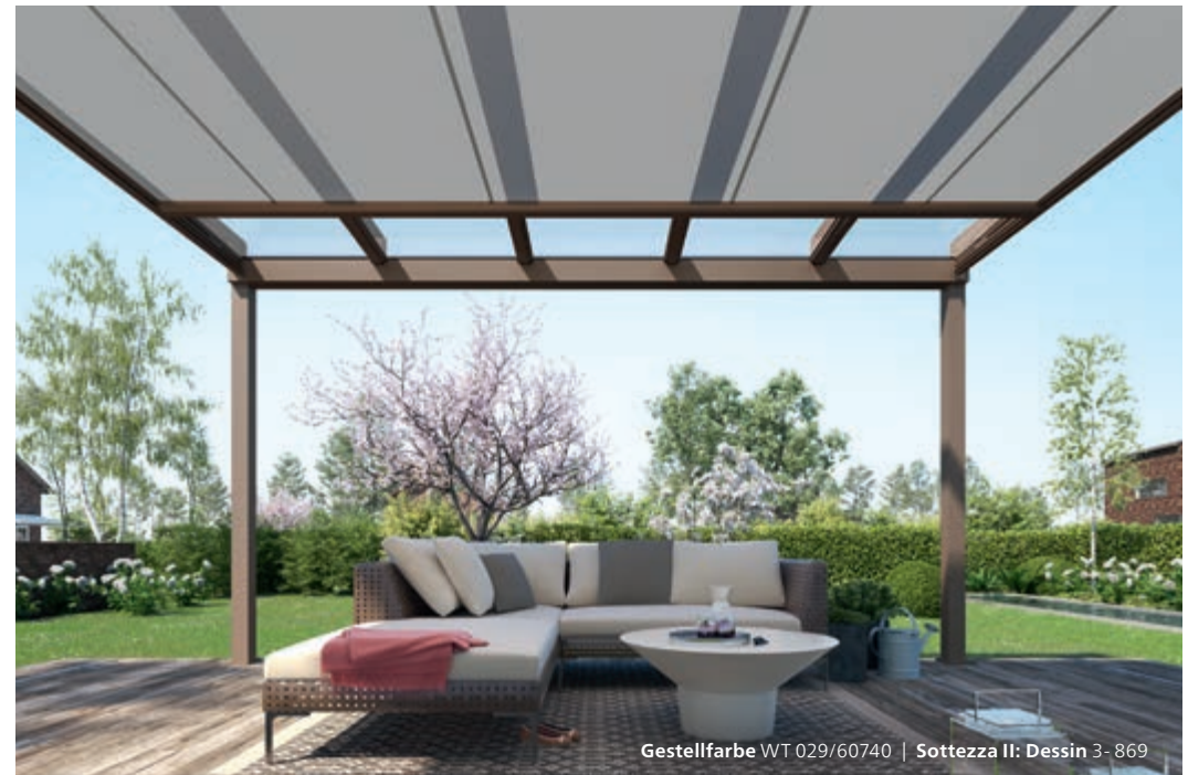
Gestellfarbe WT 029/60740 | Sottezza II: Dessin 3- 869

Ein angenehmes Klima auf Ihrer Terrasse verspricht die Wintergarten-Markise Sottezza II . Der dekorative Sonnenschutz ist formschön, schlank, zurückhaltend – und pflegeleicht. Denn Sottezza II ist unter dem Terrassendach angebracht. Das schützt sie vor Feuchtigkeit und Schmutz, das Tuch bleibt attraktiv und sauber.