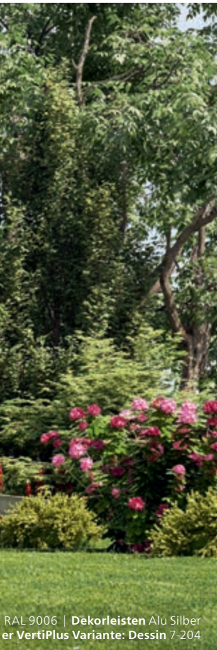
RAL 9006 | Dekorleisten Alu Silber er VertiPlus Variante: Dessin 7-204