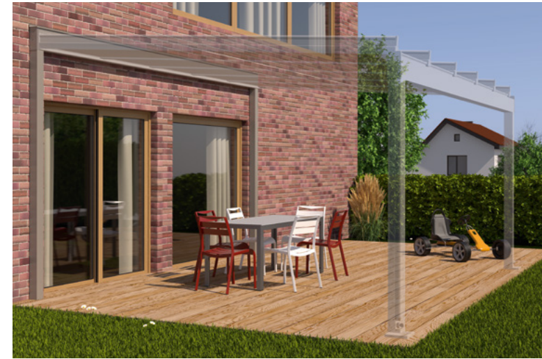
Beispiel Klinkerfassade, Tragender Wandanschluss und Terrazza Semptra