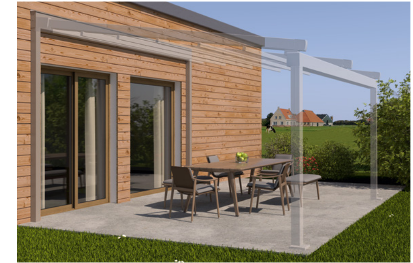
Beispiel Fertighaus an Holzständerwerk, Tragender Wandanschluss und weinor PergoTex II