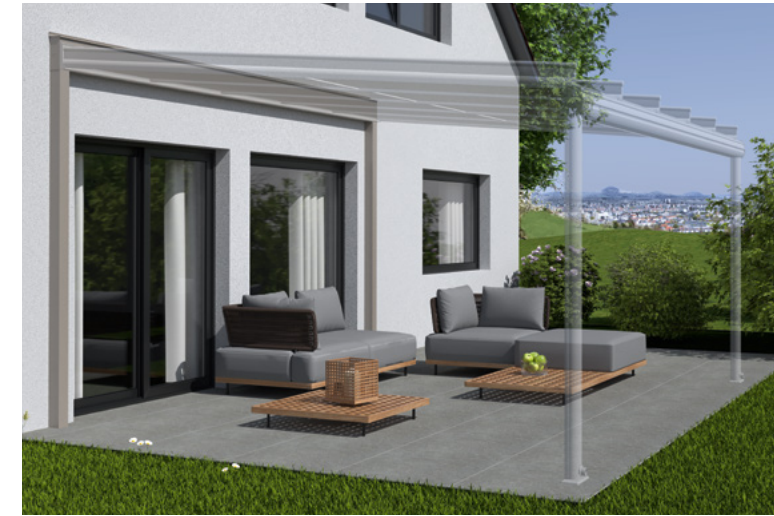
Beispiel stark gedämmte Hausfassade, Tragender Wandanschluss und Terrazza Originale