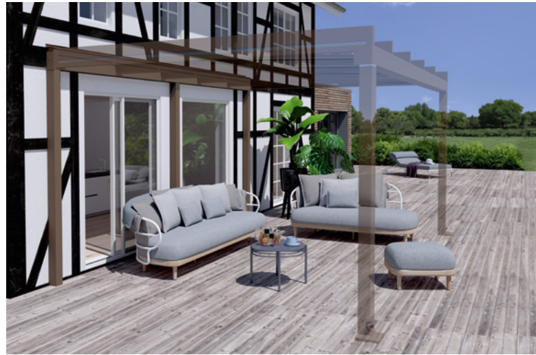
Beispiel Fachwerkfassade, Tragender Wandanschluss und Terrazza Pure